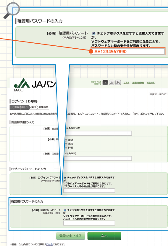
▲ ログインID取得画面

②「ログインID取得」画面の確認用パスワード欄に「 管理番号 」を入力してください。